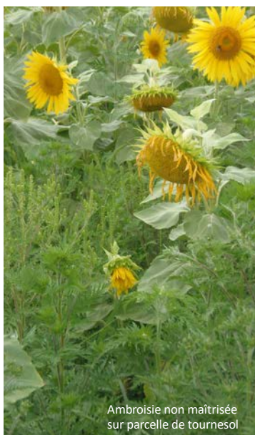
Ambrosie non maîtrisée sur parcelle de tournesol