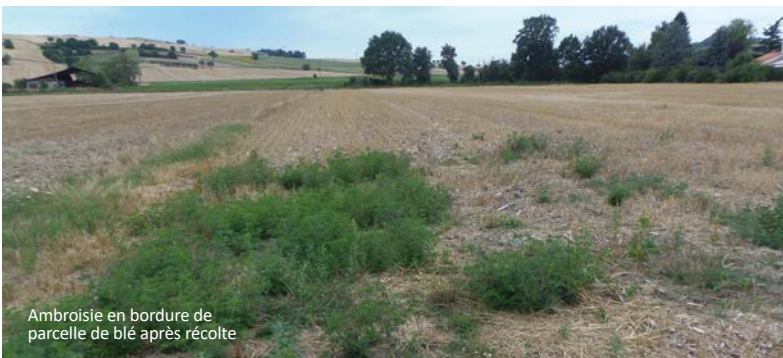
Ambrosie en bordure de parcelle de blé après récolte

Les cultures intermédiaires et autres couverts, s'ils sont mis en place rapidement après la récolte avec une installation rapide, apportent une compétition à l'ambroisie pour l'espace et les ressources. Ces couverts sont d'autant plus efficaces s'ils très couvrants (choisir des espèces adaptées).